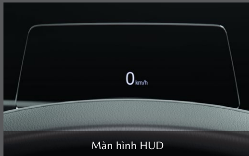
Màn hình HUD