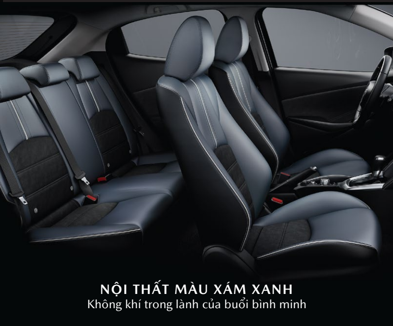
NỘI THẤT MÀU XÁM XANH Không khí trong lành của buổi bình minh