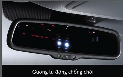
Gương tự động chống chói