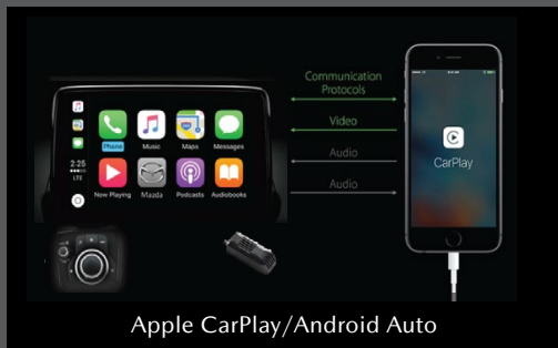
Apple CarPlay/Android Auto

Tận hưởng việc lái xe như một niềm vui với các trang bị cao cấp, tiện lợi được lựa chọn cẩn thận và dễ dàng sử dụng.