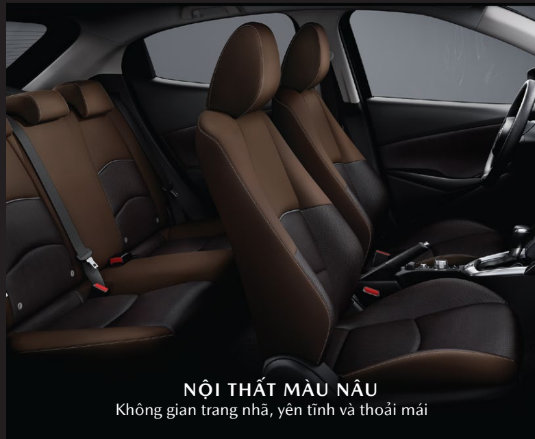
NỘI THẤT MÀU NÂU Không gian trang nhã, yên tĩnh và thoải mái